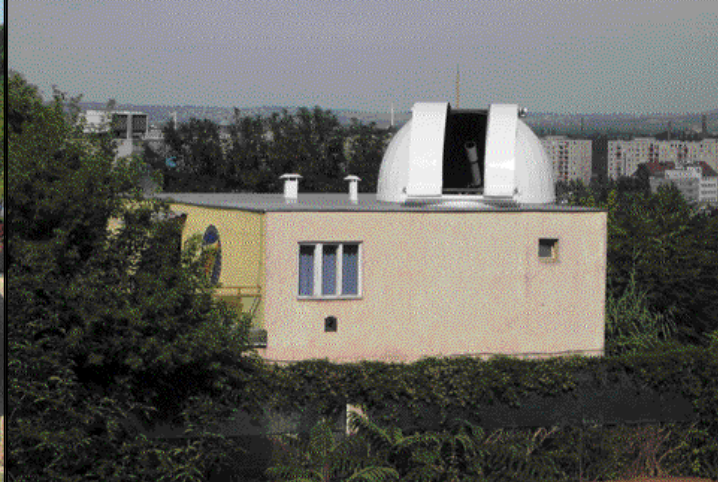
A Polaris Csillagvizsgáló épülete